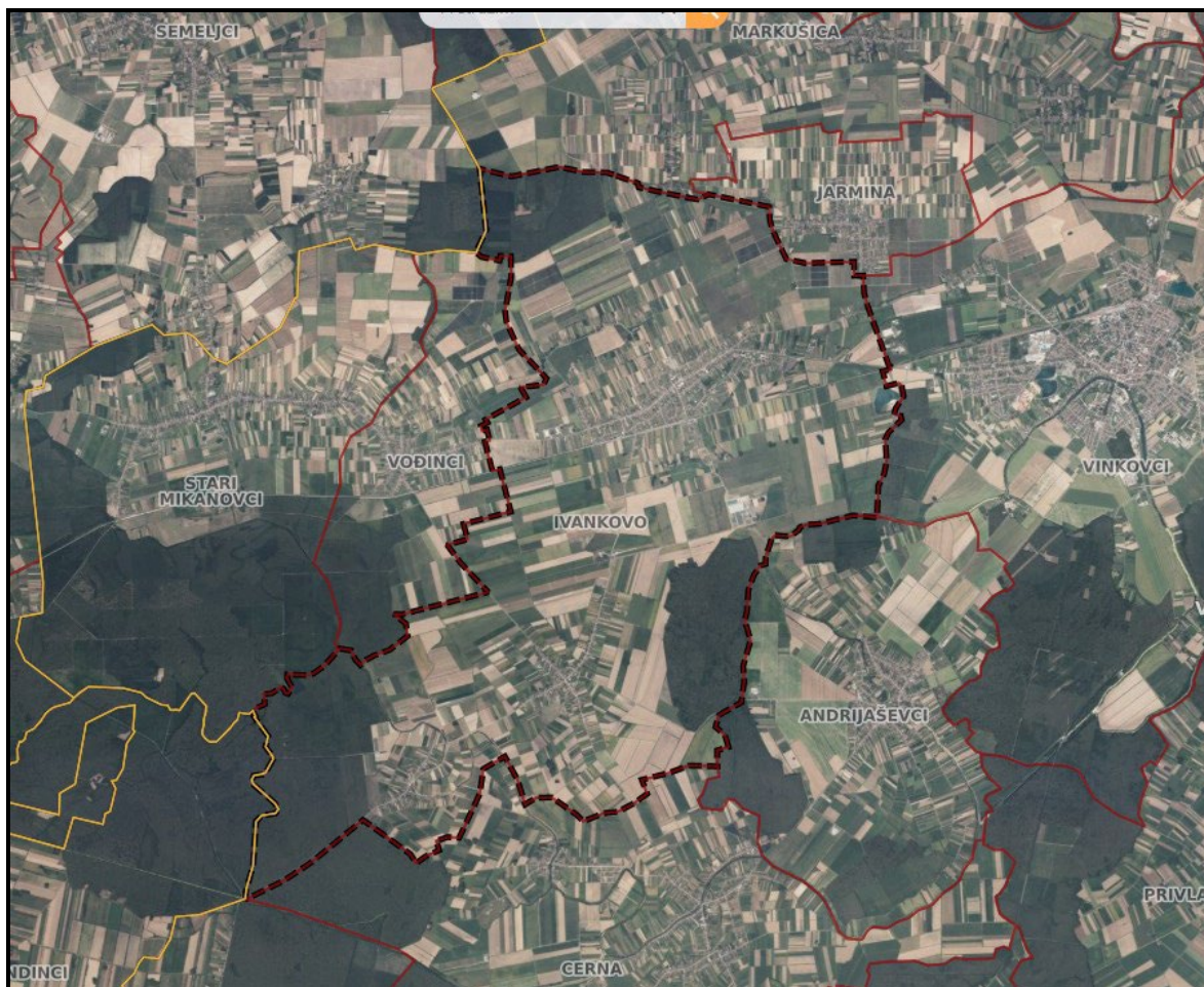
Grafički prikaz broj 1. "Granica obuhvata prostornog plana (administrativna granica Općine Ivankovo) iz modula ePlanovi"

Nakon analize administrativne granice, odnosno obuhvata prostornog plana Općine Ivankovo prema podacima dobivenih od Državne geodetske uprave, Središnjeg ureda, Službe za infrastrukturu prostornih podataka iz Registra prostornih jedinica utvrđeno je da se razlikuje od prikazane u trenutno važećem Prostornom planu uređenja Općine Ivankovo.