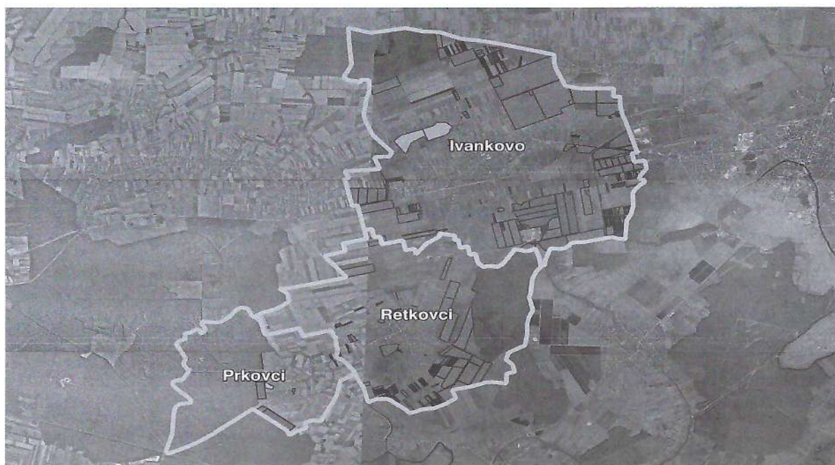
Slika 2. Prikaz poljoprivrednog zemljišta u vlasništvu Republike Hrvatske na području Općine Ivankovo

Kopija katastarskog plana sa prikazom svih katastarskih čestica poljoprivrednog zemljišta u vlasništvu RH sa podlogom digitalne ortofoto karte Općine Ivankovo izrađena je prema službeno dostavljenim podacima Državne geodetske uprave, podataka Općine Ivankovo i Ministarstva poljoprivrede za potrebe izrade Programa i nalazi se u PRILOGU KKP-1.