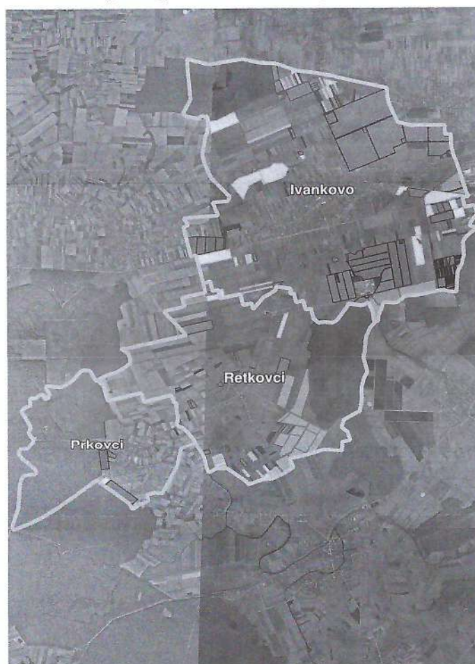
Slika 3: Poljoprivrednog zemljišta sa dosadašnjim oblicima raspolaganja, Izvor: Državna geodetska uprava, obrada autora

Kopija katastarskog plana sa prikazom svih katastarskih čestica poljoprivrednog zemljišta u vlasništvu RH koje su pod jednim od oblika raspolaganja, sa podlogom digitalne ortofoto karte Općine Ivankovo izrađena je prema službeno dostavljenim podacima Državne geodetske uprave, podataka Općine