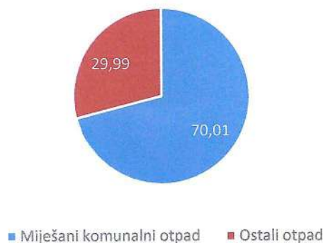
Količina deponiranog miješanog komunalnog otpada u strukturi ukupno prikupljenog otpada